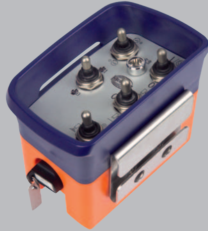
Ausführung mit Kippschaltern.

Verschiedenste Maschinen und Spezialanwendungen.