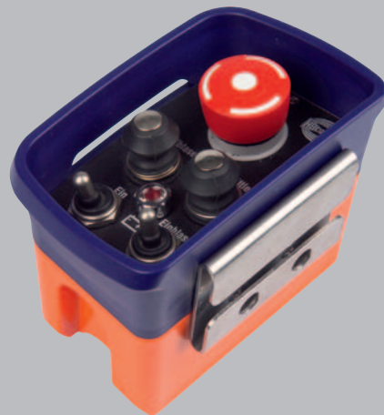
Ausführung mit Drucktastern und Kippschaltern.