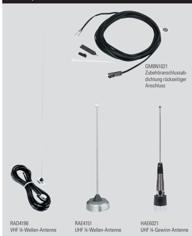
GMBN1021 Zubehörschlussab- dichtung rückseitiger Anschluss