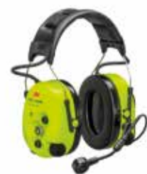
3M™ PELTOR™ WS ProTac XPI