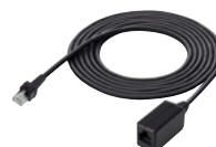
OPC-2355 Länge: 2,5 m